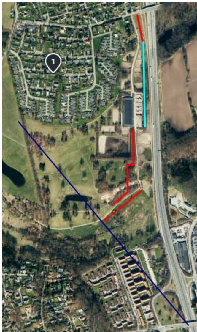
Billede 2 – Støjafskærmning langs motorvejen fra Egebækvej til kirkestien samt markeret mulig beskyttelseszone fra Skodsborgvej

Forslaget vil formentlig også betyde et væsentligt bedre lyd klima i hele det fredede område, med alle de hestefolde, der ligger syd for Grundejerlauget Holte Avlsgårds bebyggelse og vest for Rideskolen.